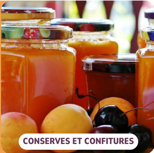
CONSERVES ET CONFITURES