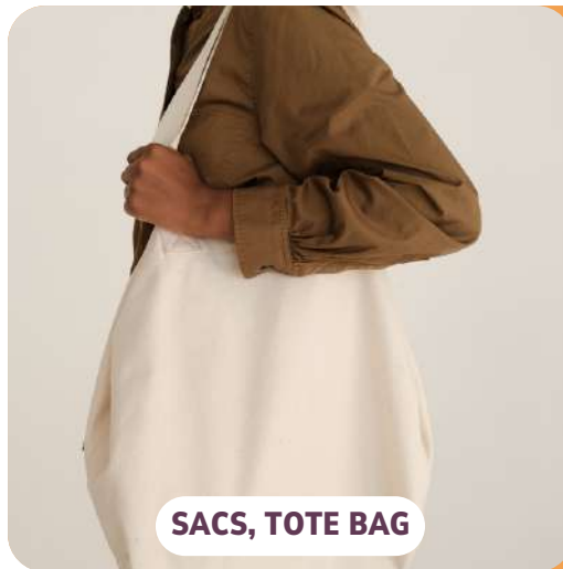
SACS, TOTE BAG