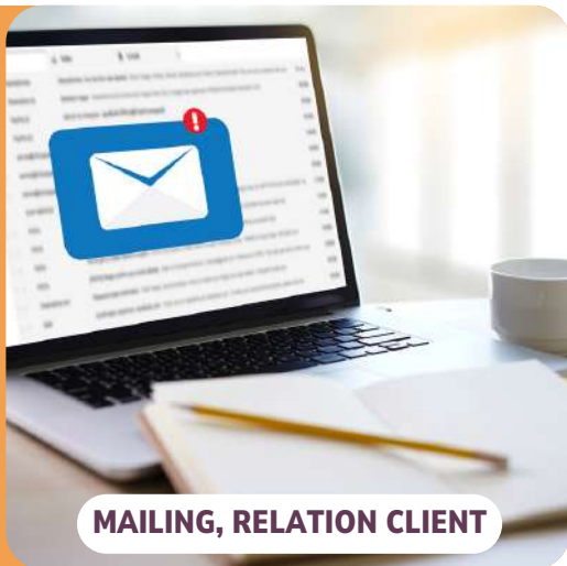
MAILING, RELATION CLIENT