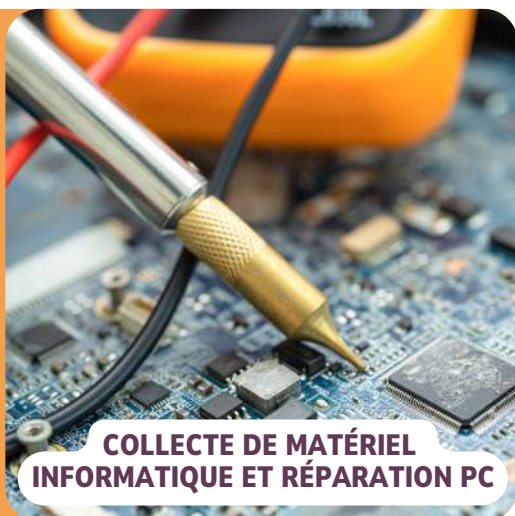
COLLECTE DE MATÉRIEL INFORMATIQUE ET RÉPARATION PC