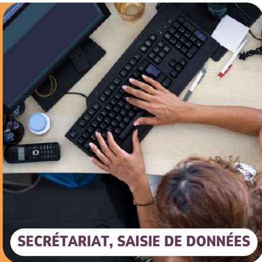
SECRÉTARIAT, SAISIE DE DONNÉES