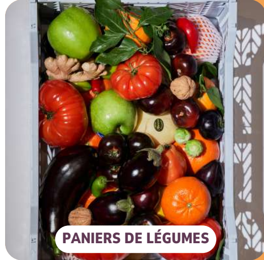
PANIER DE LÉGUMES