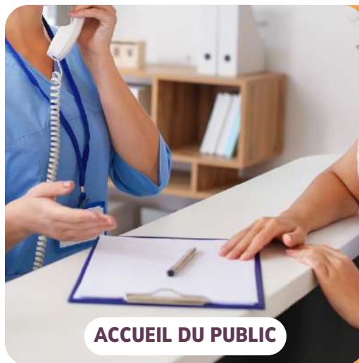
ACCUEIL DU PUBLIC