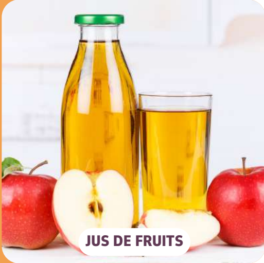
JUS DE FRUITS