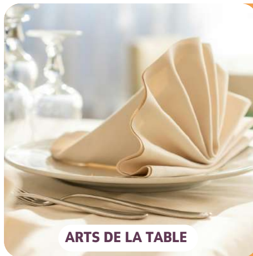
ARTS DE LA TABLE