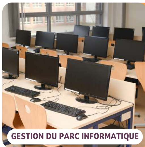
GESTION DU PARC INFORMATIQUE