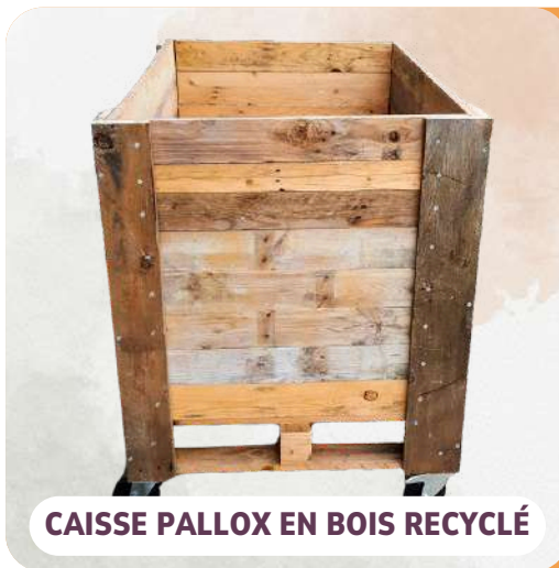
CAISSE PALLOX EN BOIS RECYCLÉ