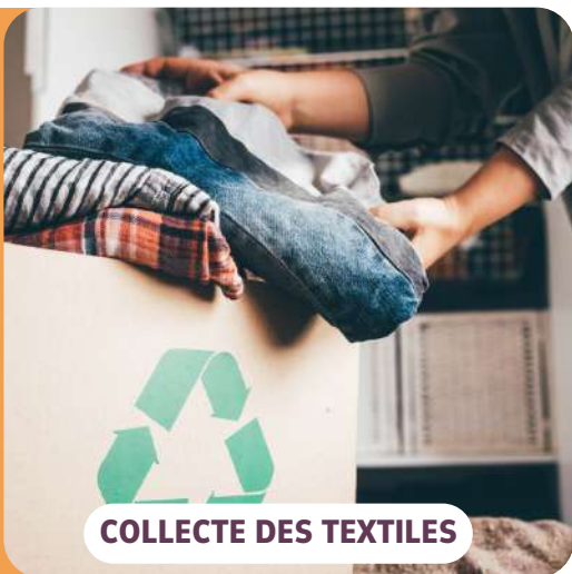
COLLECTE DES TEXTILES