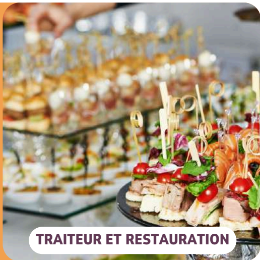
TRAITEUR ET RESTAURATION