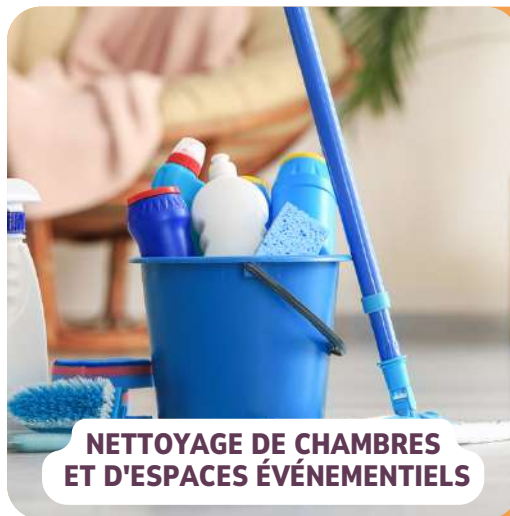
NETTOYAGE DE CHAMBRES ET D'ESPACES ÉVÈNEMENTIELS