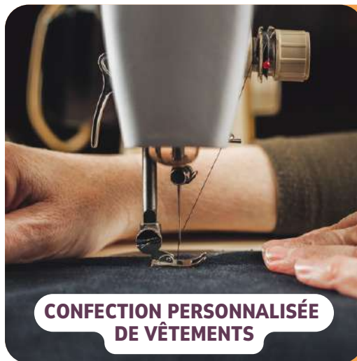
CONFECTION PERSONNALISÉE DE VÊTEMENTS