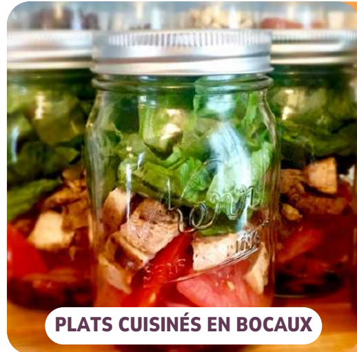
PLATS CUISINÉS EN BOCAUX