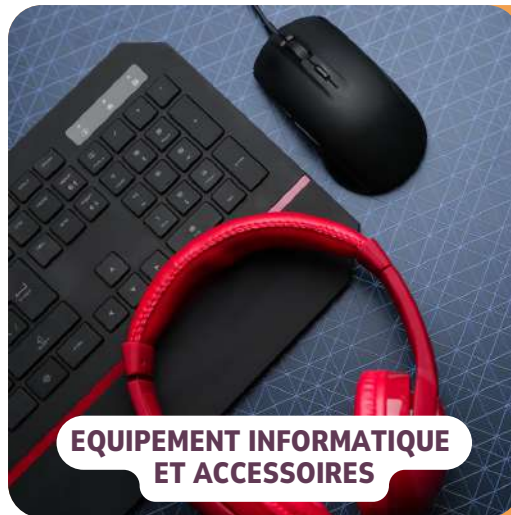
EQUIPEMENT INFORMATIQUE ET ACCESSOIRES