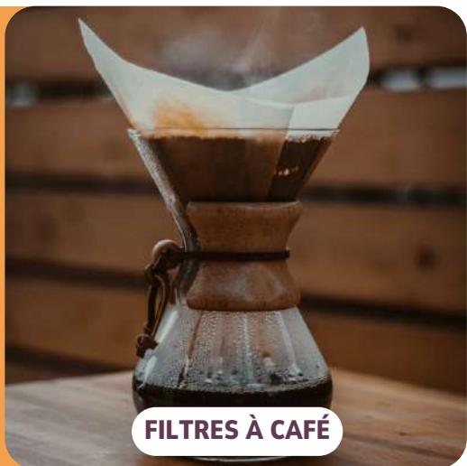
FILTRES À CAFÉ