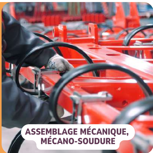
ASSEMBLAGE MÉCANIQUE, MÉCANO-SOUDURE