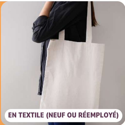
EN TEXTILE (NEUF OU RÉEMPLOYÉ)