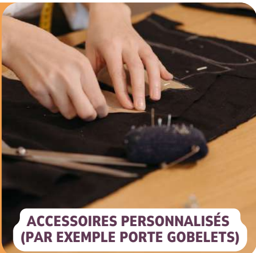
ACCESSOIRES PERSONNALISÉS (PAR EXEMPLE PORTE Gobelets)