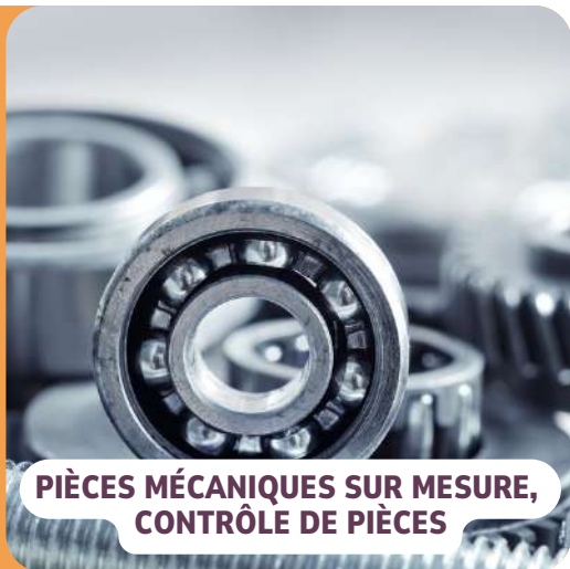
PIÈCES MÉCANIQUES SUR MESURE, CONTRÔLE DE PIÈCES