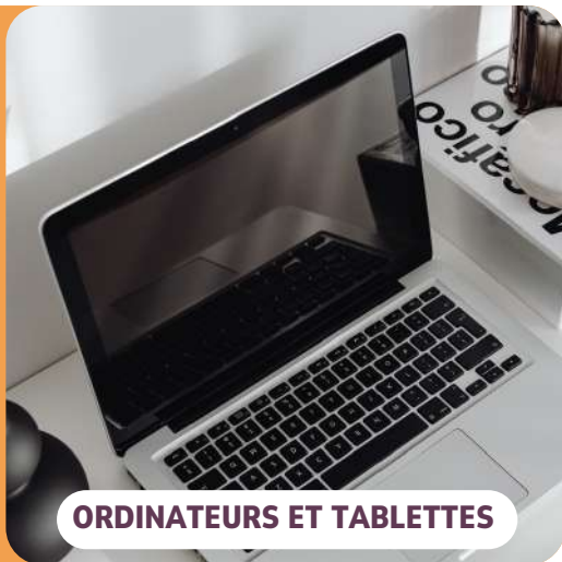
ORDINATEURS ET TABLETTES