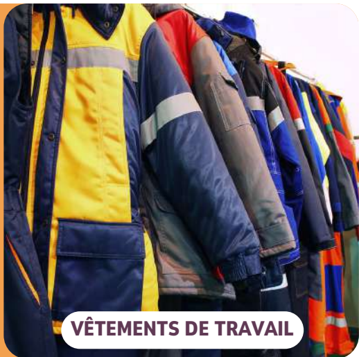
VÊTEMENTS DE TRAVAIL